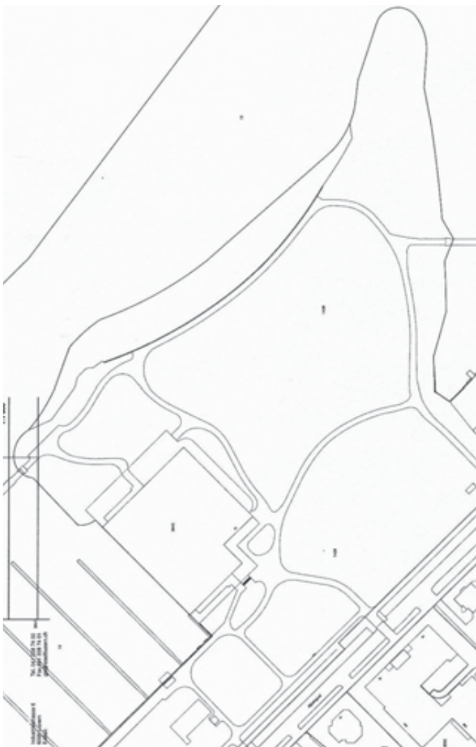
Abbildung unten: Ausschnitt Ortsplan Luzern, Ufschötti (Massstab 1:1'000) (Geoinformation & Vermessung, Luzern, ohne Datum)

bemüht sie sich um Fusionen mit den Agglomerationsgemeinden. Zudem verfolgt die Stadt Luzern die Ziele, „ein attraktives Wohnangebot für alle Bevölkerungsschichten anbieten zu können, den Marktplatz für innovative Dienstleistungen und Waren auszubauen und sich als eine international bekannte Top-Destination im Tourismus mit kultureller Ausstrahlung zu präsentieren“ (Stadtrat Luzern auf www.stadt Luzern.ch , 2007, S. 29).