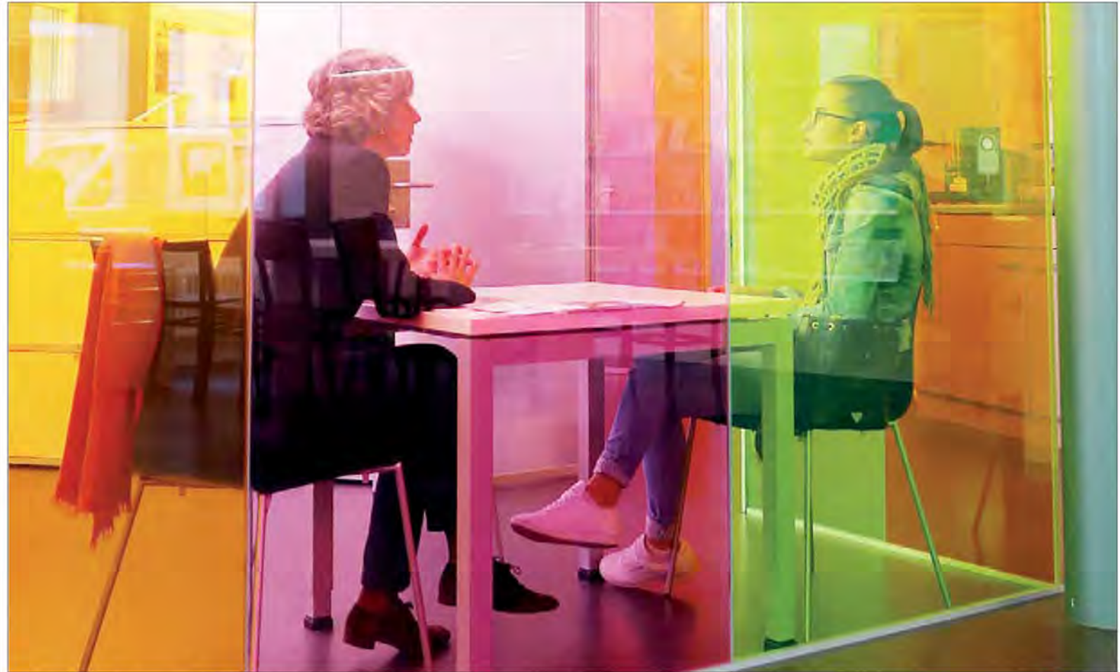
Konzentriert und relaxed zugleich – Kompetenz und Vertrauen an der Rotachstrasse 24