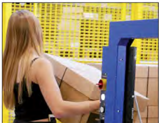
«Job Shop/Info Shop» ist eine Beratungsstelle mit integrierter Arbeitsvermittlung für 16- bis 25-Jährige

In den 20 Jahren unseres Bestehens war unsere Türe immer offen. Alle Jugendlichen sind jederzeit willkommen. Bewerbungen kann man bei uns zum Beispiel immer schreiben und alle Fragen sind jederzeit willkommen. hu