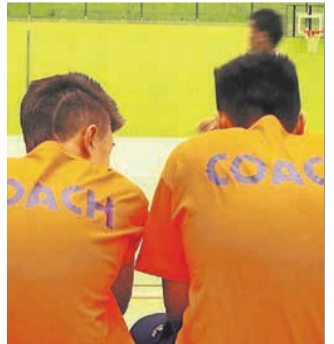
Am Spielfeldrand tauschen sich die Coaches aus.