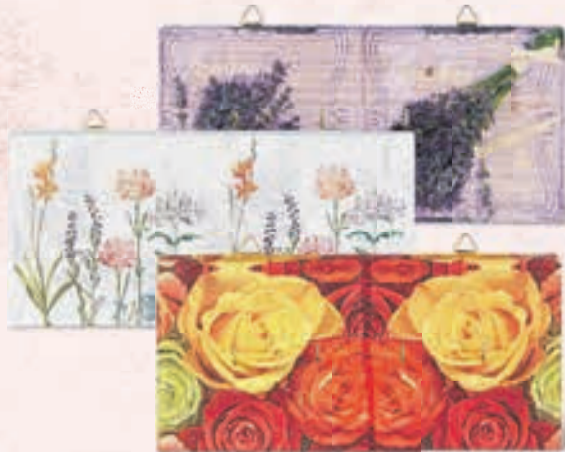
Schlüsselbretter Fr. 5.–/Stk.