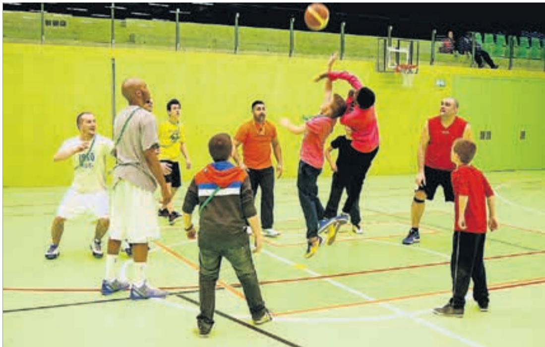
Jugendliche treten beim Basketball in der Sporthalle Hardau gegeneinander an.

Im Zusammenhang mit dem Midnight-Sports Special steht das beliebte Fussball-Turnier «Political Soccer», bei dem die Jugendlichen gegen Teams aus Stadt- und Gemeinderätinnen und -räte sowie Stadtratskandidierende antreten. «Die Jugendlichen wollen klar besser sein als die Erwachsenen. Gewiss ist es für sie aber auch motivierend, aus dem gewohnten Umfeld rauszukom-