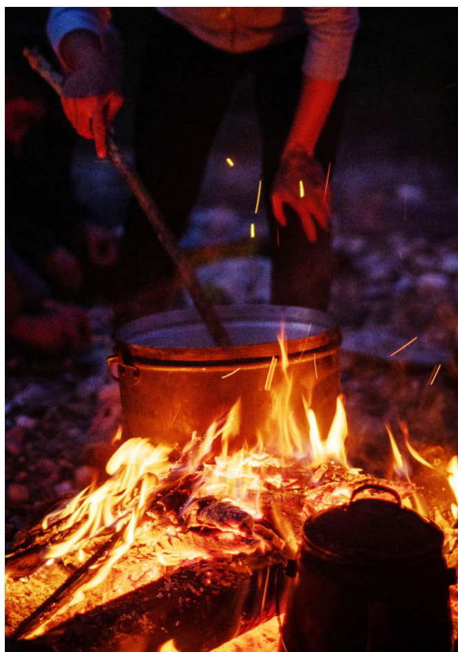
... bis zum Abendessen kochen wird alles selbst gemacht.

Die Jugendlichen wurden aktiv in Entscheidungsprozesse einbezogen und gestalteten Abläufe mit. Erfahrungen wurden im gemeinsamen Tun ermöglicht und anschliessend alters- und situationsgerecht reflektiert. Parallel zur Arbeit mit den Jugendlichen diente das Projekt als Aufbau- und Entwicklungsarbeit innerhalb der OJA Zürich. Erfahrungen, Abläufe und Materialien wurden reflektiert und dokumentiert, um sie für zukünftige Projekte nutzbar zu machen.