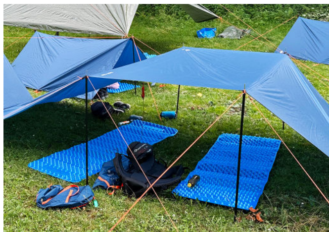
Übernachtet wird in selbstgebauten Tarps.

Das Projekt leistete damit einen nachhaltigen Beitrag zur persönlichen und sozialen Entwicklung Jugendlicher und bildete zugleich eine wichtige Grundlage für die Weiterentwicklung erlebnispädagogischer Angebote innerhalb der Offenen Jugendarbeit Zürich.